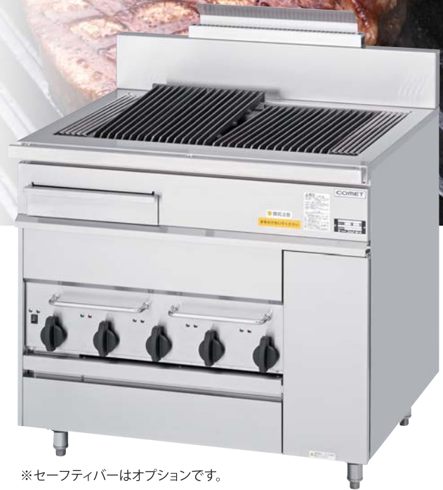
※セーフティバーはオプションです。

多彩なバリエーションを ラインナップした ガスレンジ DX2 シリーズに チャーグロウが新登場。 立消え安全装置付で、 より安全にご使用いただけます。