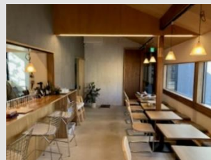
大きな窓が特徴的な開放的な空間