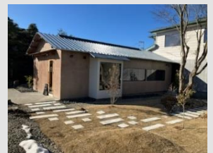
中庭があり、落ち着いた雰囲気