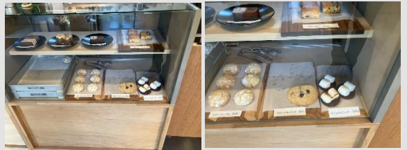
ショーケースに並ぶ焼き菓子